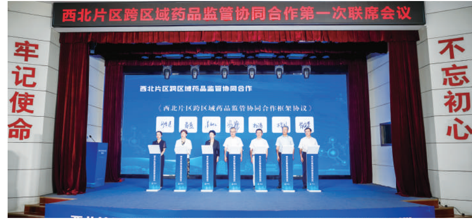
西北片区跨区域药品监管协同合作第一次联席会议在陕西西安召开。

队伍，为监管工作提供专业支撑，打造高素质专业化监管人才队伍。 （三）打造特色产业与科普宣传体系 大力推进中药材GAP基地建设，截至2025年9月30日，已验收基地9家，完成立项70家，为中医药产业发展提供优质原料保障。完善中药标准体系，发布4批446项中药配方颗粒标准，牵头编撰《陕西道地中药材》，制定《陕西省中药材产地趁鲜切制加工指导原则》，填补部分特色中药品种标准空白，助力“秦药”品牌提升影响力，呼应省人大代表关于推动中医药产业高质量发展的建议。 在化妆品产业领域，成功入选国家化妆品个性化服务第二阶段试点省份，从2025年10月1日起，符合条件的企业可开展普通化妆品现场调配、分装服务，释放产业发展新活力。构建立体化科普宣传网络，打造573个科普宣传角，制作发布科普视频近30个，播放量达1200万次；开展“共筑药安陕西护航健康生活”、药品安全“文艺演出”、“秦药”特色产品展示、“你点我检”等主题活动，提升公众药品安全意识，营造社会共治良好氛围。 （四）释放政策红利，优化发展环境 联合省工信厅、财政厅印发仿制药一致性评价奖励政策，累计为130个药品品种兑现奖励资金5270万元，激励企业提升产品质量。建立“医药产业发展联席会议”制度，协调