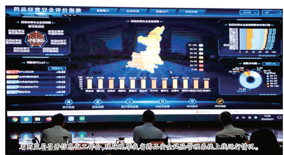
省药监局召开信息化工作会，现场观摩我省药品安全风险管理系统上线运行情况。

安全是药品的生命线。陕西省药监局严格落实“四个最严”要求，构建全链条、全方位、全覆盖的监管体系，以铁腕监管守护人民群众用药安全有效，让每一份药品都承载起民生温度。 （一）全链条监管，压实各方责任 药品研发数据的真实性、规范性直接决定药品上市后的安全有效性。陕西省药监局出台《陕西省药物临床试验机构日常监督检查办法》等文件，建立“日常检查+专项检查+飞行检查”三位一体监管模式，将全省药物临床试验机构纳入常态化监管体系。 生产环节是药品质量安全的“第一道关口”。陕西省药监局坚持“监管跑在风险前面”理念，聚焦高风险品种、关键生产工序和质量控制环节，制定年度监督检查计划。建立企业分级分类监管机制，根据信用等级、产品风险程度实施差异化监管。 在药品经营环节，陕西省药监局始终保持“利剑高悬、重拳出击”的监管态势，切实守护群众用药安全“最后一公里”。创新打造“药品线上全程留痕、企业网络行为可溯”的监管模式，对网络药品销售第三方平台、线上药店进行全面排查，重点打击未取得资质网售药品、销售假劣药、处方药无处方销售等违法违规行为。对流向异常的药品及时开展核查，严厉查处“回流药”等违法违规行为。针对化妆品备案凭证“一号多用”这一行业乱象，通过比对备案信息、核查生产记录、开展飞行检查等方式，严厉打击套用备案凭证、生产未备案化妆品等行为。同时，组织开展儿童化妆品“线上线下”专项检查，严查非法添加、虚假宣传、标签不规范等问题，建立儿童化妆品生产经营企业监管台账，实现“一户一档、动态监管”。 （二）严打违法违规，强化震慑效应 深入推进“查稽结合”“抽检分离”“监检结合”，建立“五位一体”查稽协同执法联动机制，实现监管与执法无缝衔接。印发《稽查执法工作机制》，规范线索处置流程，对大案要案提级查办、挂牌