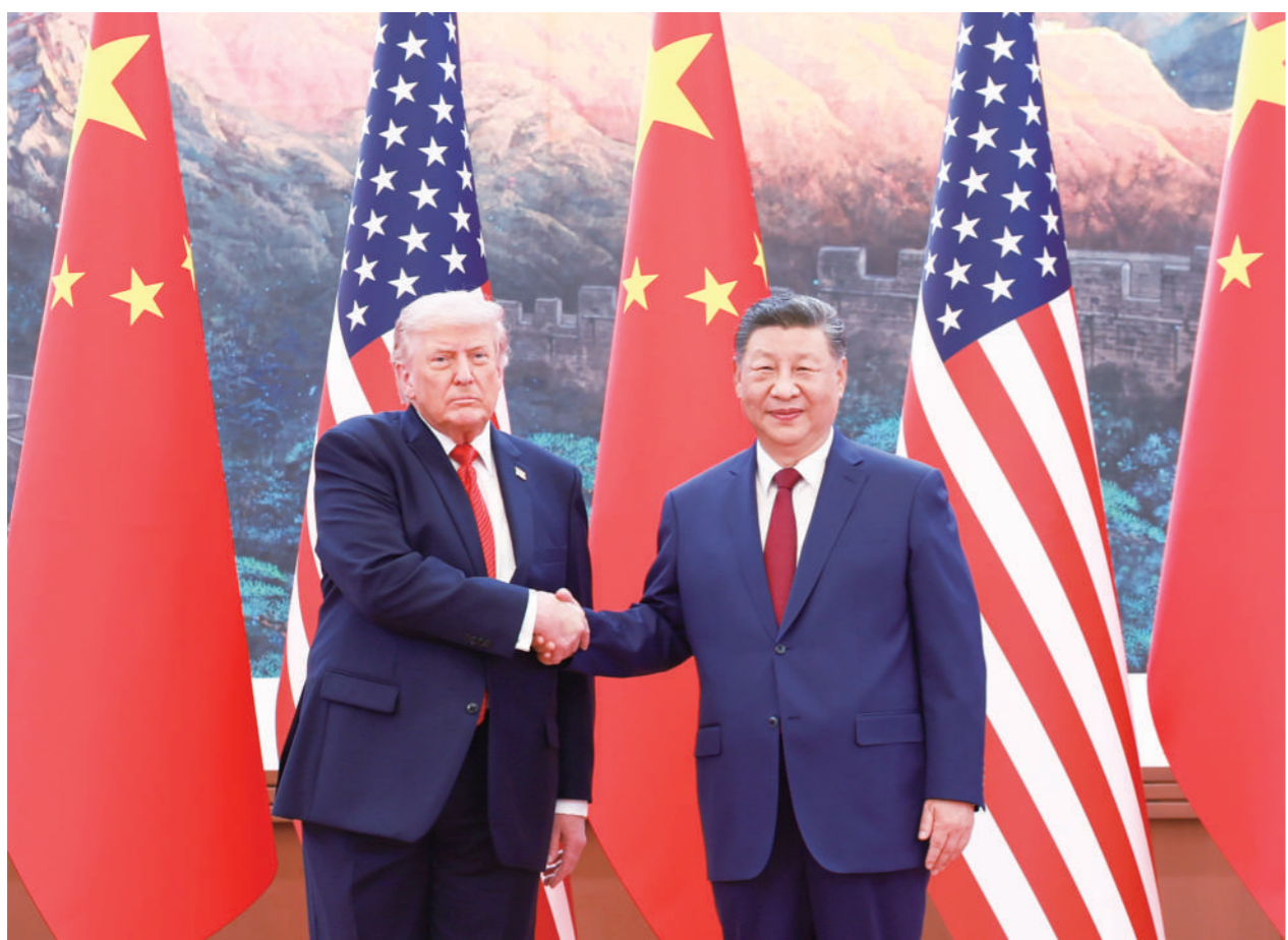
5月14日上午,国家主席习近平在北京人民大会堂同来华进行国事访问的美国总统特朗普举行会谈。