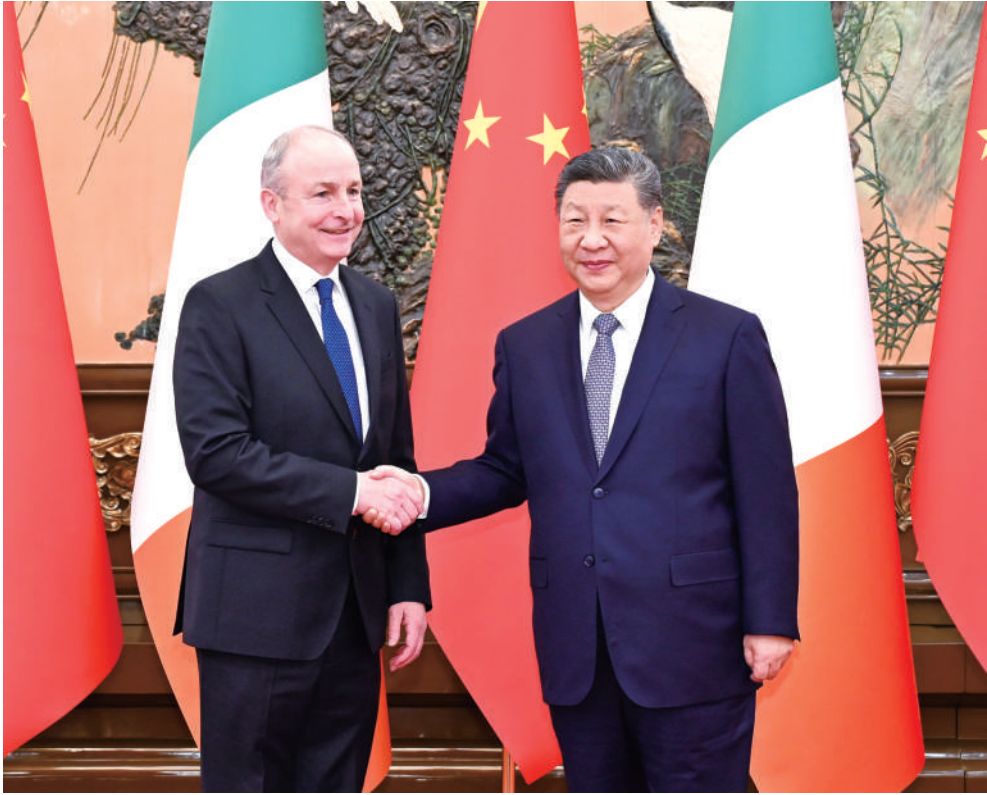
1月5日上午，国家主席习近平在北京人民大会堂会见来华进行正式访问的爱尔兰总理马丁。

新华社北京1月5日电（记者 董雪）1月5日上午，国家主席习近平在北京人民大会堂会见来华进行正式访问的爱尔兰总理马丁。