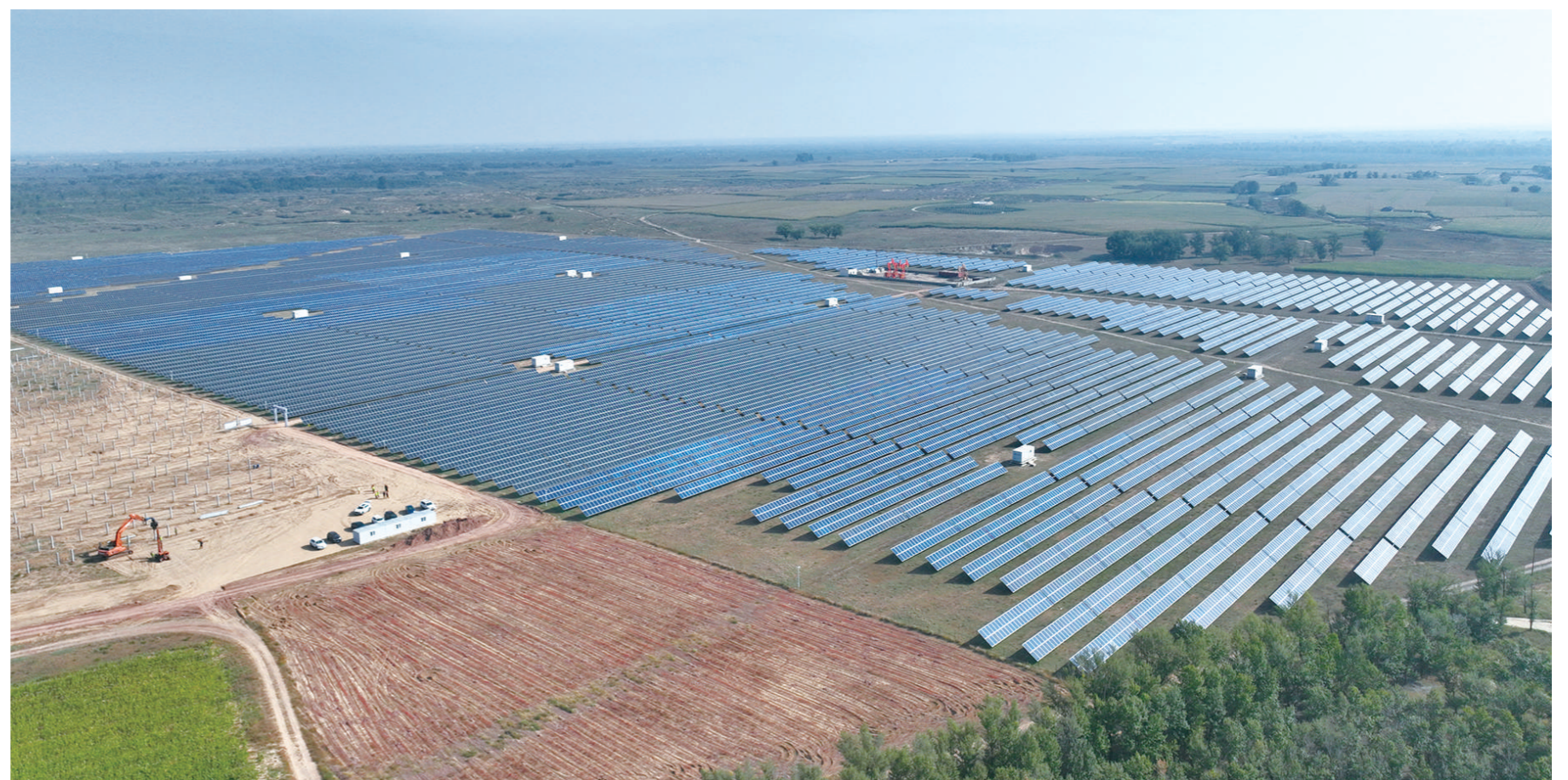
定边县砖井镇任园村“千万工程”13兆瓦新建联村电站建设现场