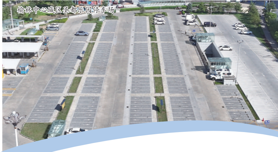
榆林中心城区绿谷国际停车场