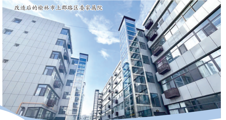
改造后的榆林市上郡路区委家属院