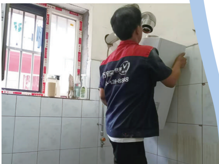
城乡接合部进行“煤改气”改造