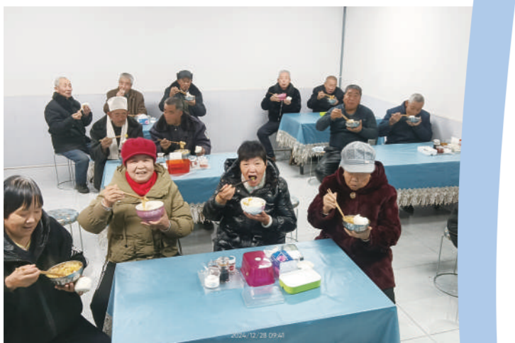
子洲县裴家湾镇园则坪村互助幸福院