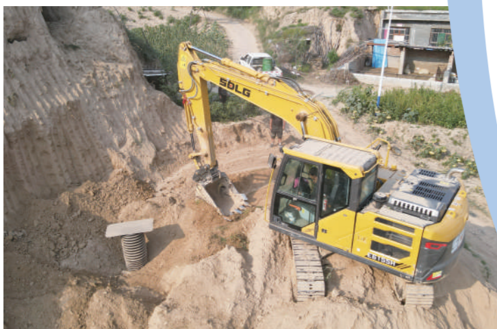
横山区韩岔镇柳卜塌村白兴庄组饮水工程建设项目