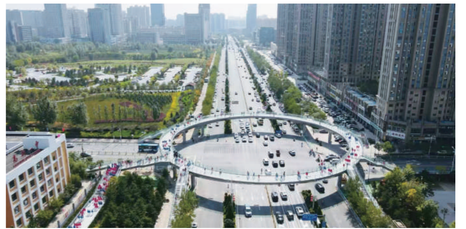
榆林中心城区高新一中新建人行天桥

此外，为解决市中心城区出行难问题，榆林市还建成榆阳区政府南广场、兴中路、建榆路、康安路口袋公园、滨河公园等停车场5个，增设停车场点23个，新增停车位5926个。并通过制定一校一策、设置护学岗、增加交通引导员、回退拆除隔离护栏、更新施划道路标线等措施，有效解决学校、医院、商场周边交通拥堵问题。