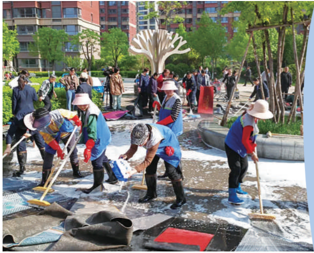
社区物业居民共同整治环境

民生所需，政之所及。2024年以来，榆林市还在城乡基础设施建设方面下足功夫，其中提升改造农村道路，全年完成982个自然村通硬化道路1886公里，整治破洞道路636公里；加强电网改造，全年实施电网工程40个，已建成投用34个；实施清洁取暖项目，采取煤改大暖、煤改气等措施，累计投资4.3亿元，实施建筑节能改造1362户，铺设天然气管道667公里，建设集中供热管网24.29公里，推动中心城区、各县城及城乡接合部3.2万户群众散煤取暖替代。完善物业管理机制，研究制定了《关于进一步加强全市物业服务管理提升工作实施方案》等文件，通过引进专业化物业、成立业委会(物管会)、社区代管、小组自管等方式，中心城区住宅小区实现物业服务全覆盖。值得一提的是，2024年，全市计划建设37所中小学、幼儿园，其中建成投用7所、正在建设30所，预计新增46695个学位，榆林教育高质量发展迈上新台阶。 (李志东)