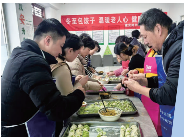
榆阳区建安路社区食堂