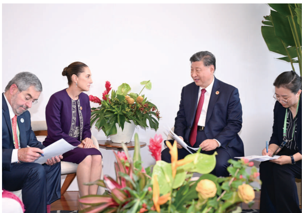
当地时间11月18日下午,国家主席习近平在里约热内卢出席二十国集团领导人峰会期间会见墨西哥总统辛鲍姆。