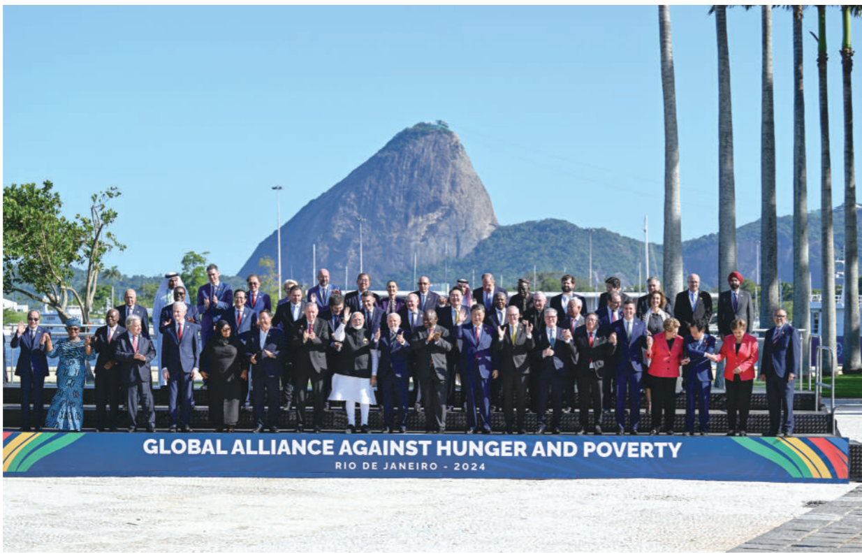
当地时间11月18日上午,国家主席习近平在巴西里约热内卢出席二十国集团领导人第十九次峰会。峰会把“构建公正的世界和可持续发展的星球”作为主题,并决定成立“抗击饥饿与贫困全球联盟”。这是习近平同与会领导人共同参加巴方发起的“抗击饥饿与贫困全球联盟”合影。