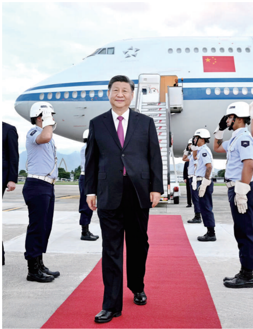
当地时间11月17日下午,国家主席习近平乘专机抵达里约热内卢,应巴西联邦共和国总统拉布拉邀请,出席二十国集团领导人第十九次峰会并对巴西进行国事访问。