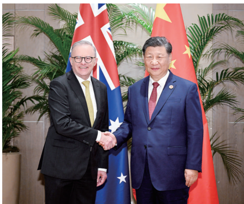
当地时间11月18日上午,国家主席习近平在里约热内卢出席二十国集团领导人峰会期间会见澳大利亚总理阿尔巴尼斯。

阿尔巴尼斯表示,很高兴在澳中全面战略伙伴关系建立十周年之际再次同习近平主席会面。自我去年访华以来,澳中关系在包括贸易在内的各领域取得令人鼓舞的进展,