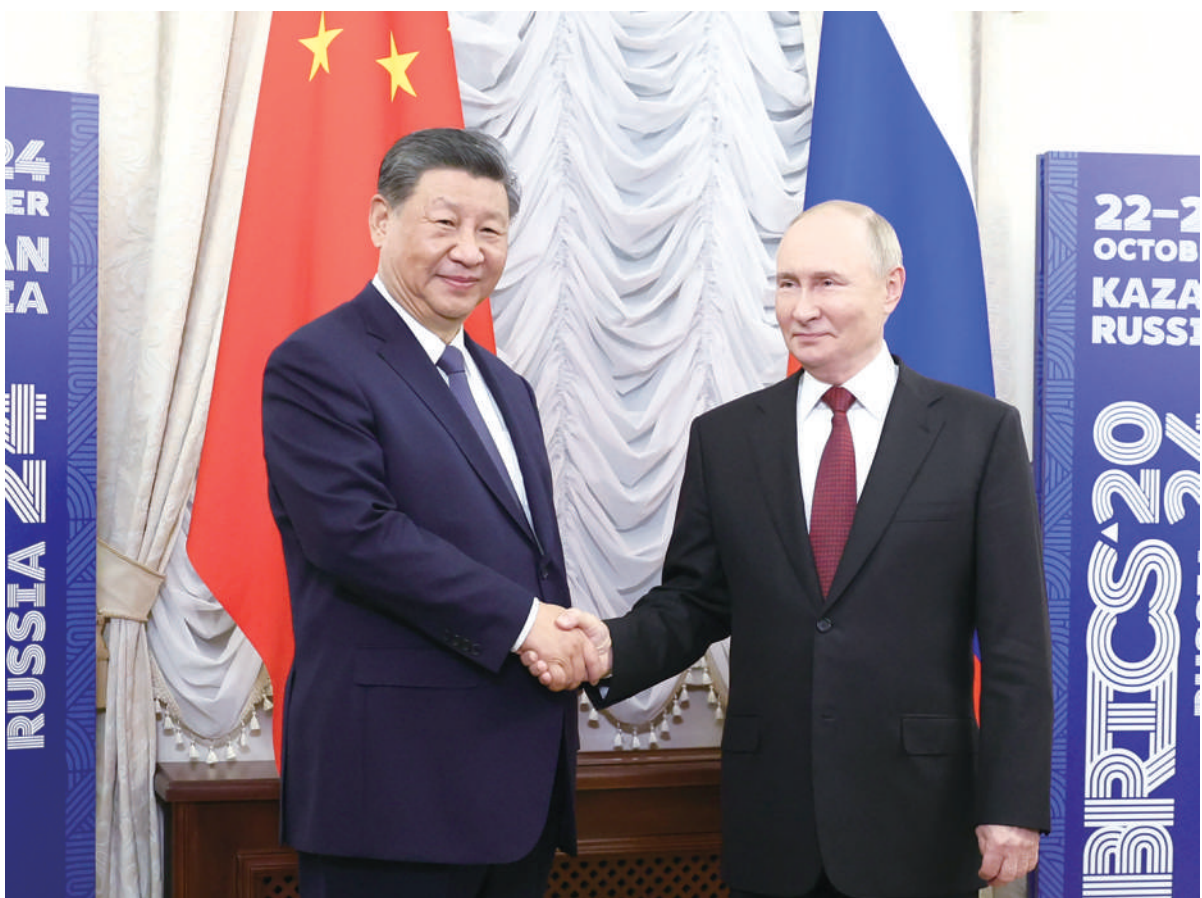
当地时间十月二十二日下午，国家主席习近平在喀山克里姆林宫同俄罗斯总统普京举行会晤。