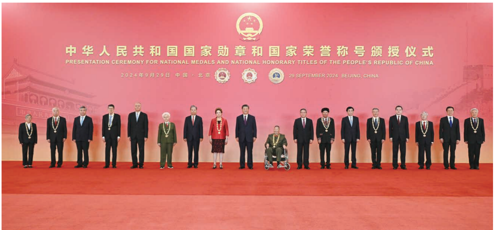
9月29日,中华人民共和国国家勋章和国家荣誉称号颁授仪式在北京人民大会堂金色大厅隆重举行。习近平等领导同志同国家勋章和国家荣誉称号获得者合影留念。

新华社北京9月29日电 中华人民共和国国家勋章和国家荣誉称号颁授仪式29日上午在北京人民大会堂金色大厅隆重举行。中共中央总书记、国家主席、中央军委主席习近平向国家勋章和国家荣誉称号获得者颁授勋章奖章并发表重要讲话。习近平强调,伟大时代呼唤英雄,造就英雄。英雄辈出,党和人民事业就会兴旺发达、长盛不衰。各级党委和政府要关心关爱英雄模范,推动全社会尊崇英雄、学习英雄、争做英雄。希望受到表彰的同志珍惜荣誉、再接再厉,争取更大荣光。