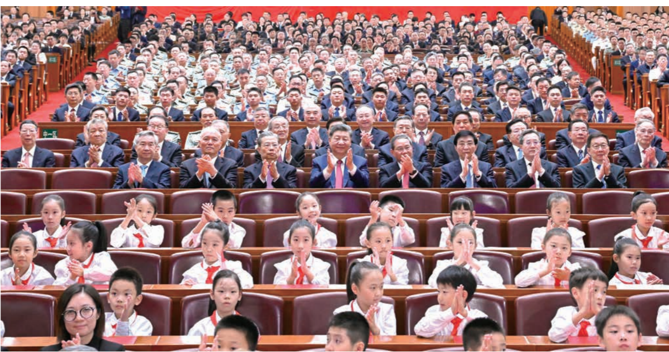
9月29日晚,庆祝中华人民共和国成立75周年音乐会在京举行。习近平、李强、赵乐际、王沪宁、蔡奇、丁薛祥、李希、韩正等党和国家领导人,同3000多名观众一起观看演出。

管弦乐《第一交响序曲》,大合唱《黄河大合唱》气势磅礴,充分展现新民主主义革命时期中国人民浴血奋战、百折不挠,在党的领导下夺取伟大胜利、建立新中国的光辉历程。《祖国颂歌》铿锵热烈,《丰收之歌》欢快喜悦,2首管弦乐重温了社会主义革命和建设时期自力更生、发愤图强的难忘岁月,激起现场观众的强烈共鸣。管弦乐《北京喜讯到边寨》,民族器乐联奏《多彩的交响》融合不同民族、不同地域的特色音调,以优美的旋律讴歌祖国大好河山和人民