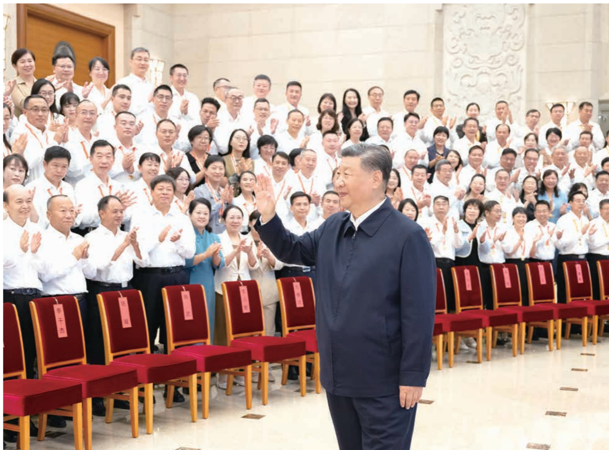
九月九日,党和国家领导人习近平、李强、蔡奇、丁薛祥等在北京接见参加庆祝第十个教师节暨全国教育系统先进集体和先进个人表彰活动代表。

新华社北京9月10日电 全国教育大会9日至10日在北京召开。中共中央总书记、国家主席、中央军委主席习近平出席大会并发表重要讲话。他强调,建成教育强国是近代以来中华民族梦寐以求的美好愿望,是实现以中国式现代化全面推进强国建设、民族复兴伟业的先导任务、坚实基础、战略支撑,必须朝着既定目标扎实迈进。