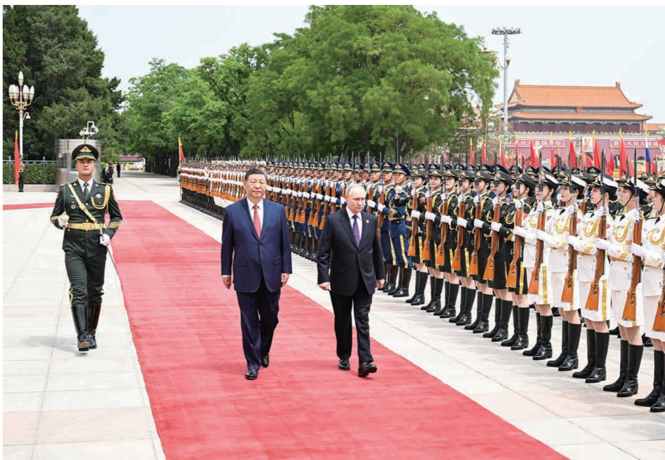
5月16日上午,国家主席习近平在北京人民大会堂同来华进行国事访问的俄罗斯总统普京举行会谈。这是会谈前,习近平在人民大会堂东门外广场为普京举行隆重欢迎仪式。