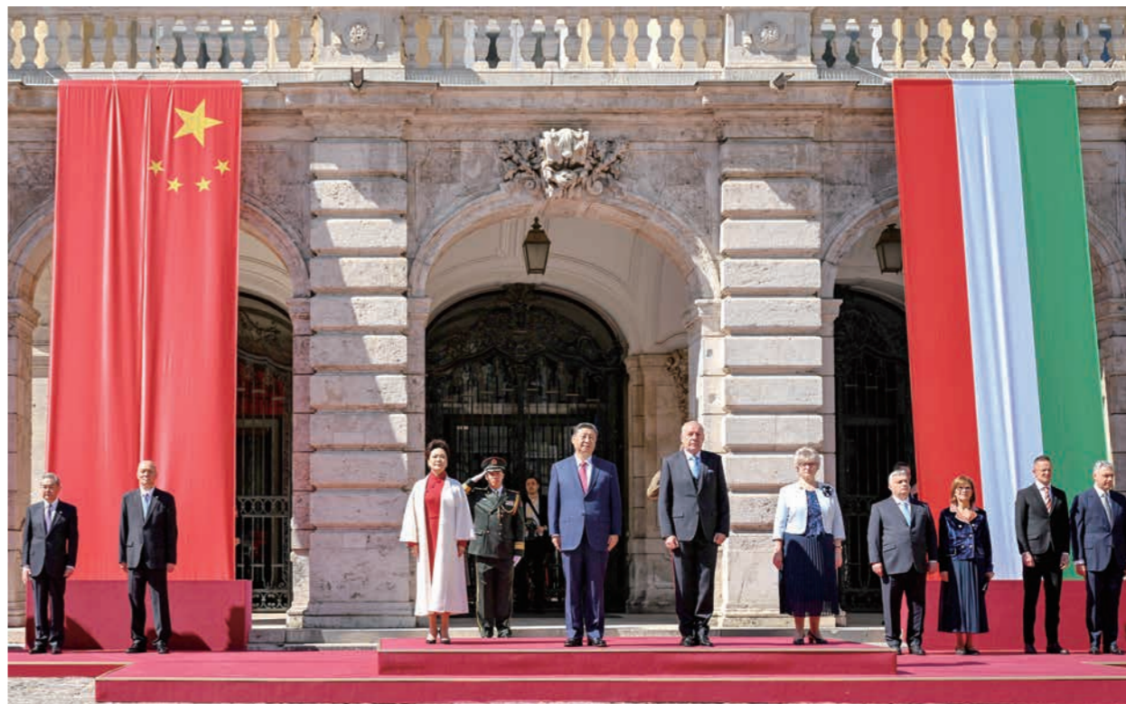
当地时间5月9日上午,国家主席习近平在布达佩斯出席匈牙利总统舒尤克和总理欧尔班共同举行的隆重欢迎仪式。