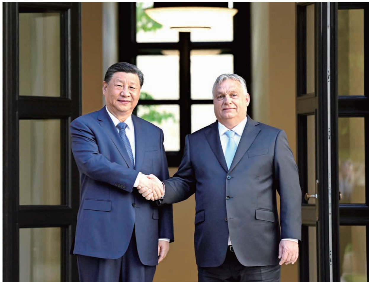
当地时间5月9日下午,国家主席习近平在布达佩斯总理府同匈牙利总理欧尔班举行会谈。