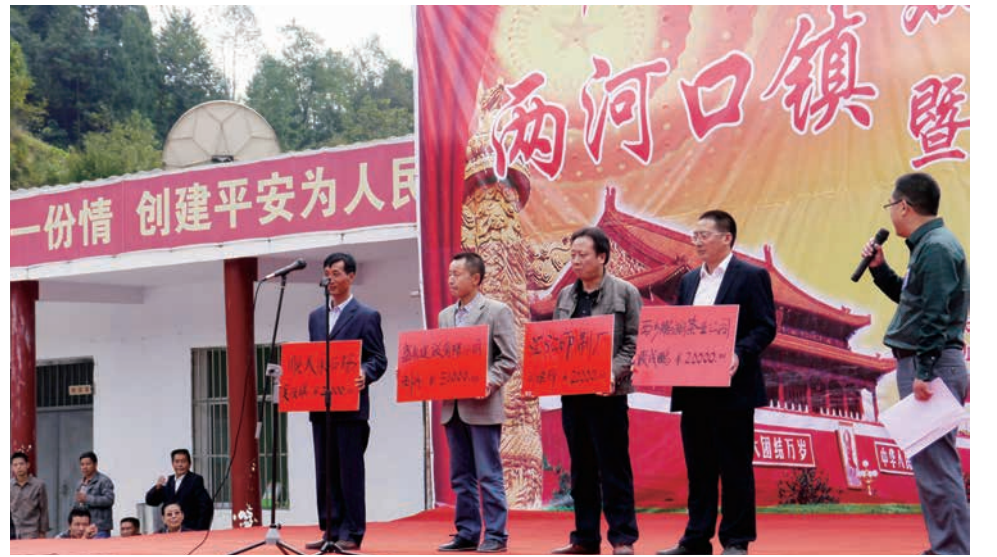
双高双普汇演捐赠现场