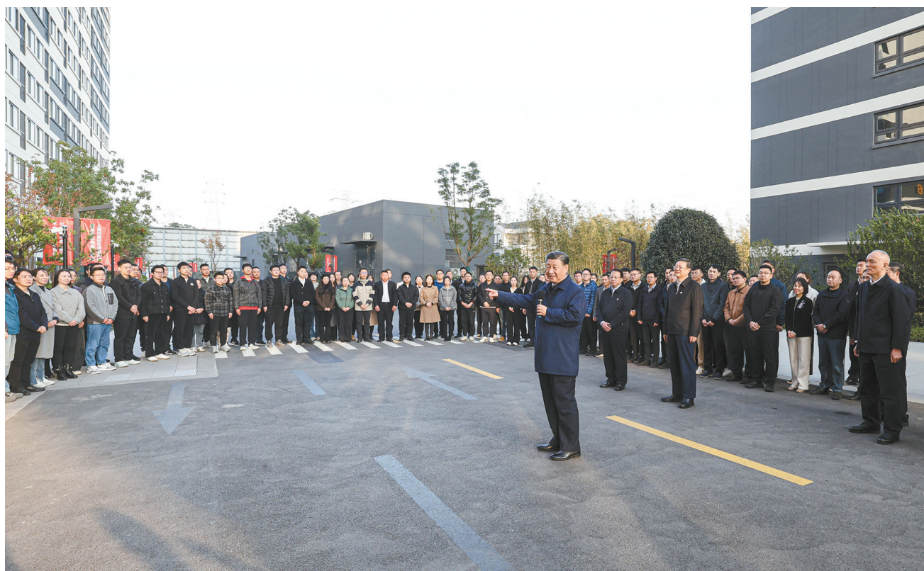
11月28日至12月2日,中共中央总书记、国家主席、中央军委主席习近平在上海考察。这是11月29日下午,习近平在闵行区新时代城市建设者管理者之家,同社区居民亲切交流。

新华社上海/江苏盐城12月3日电 中共中央总书记、国家主席、中央军委主席习近平近日在上海考察时强调,上海要完整、准确、全面贯彻新发展理念,围绕推动高质量发展、构建新发展格局,聚焦建设国际经济中心、金融中心、贸易中心、航运中心、科技创新中心的重要使命,以科技创新为引领,以改革开放为动力,以国家重大战略为牵引,以城市治理现代化为保障,勇于开拓、积极作为,加快建成具有世界影响力的社会主义现代化国际大都市,在推进中国式现代化中充分发挥龙头带动和示范引领作用。