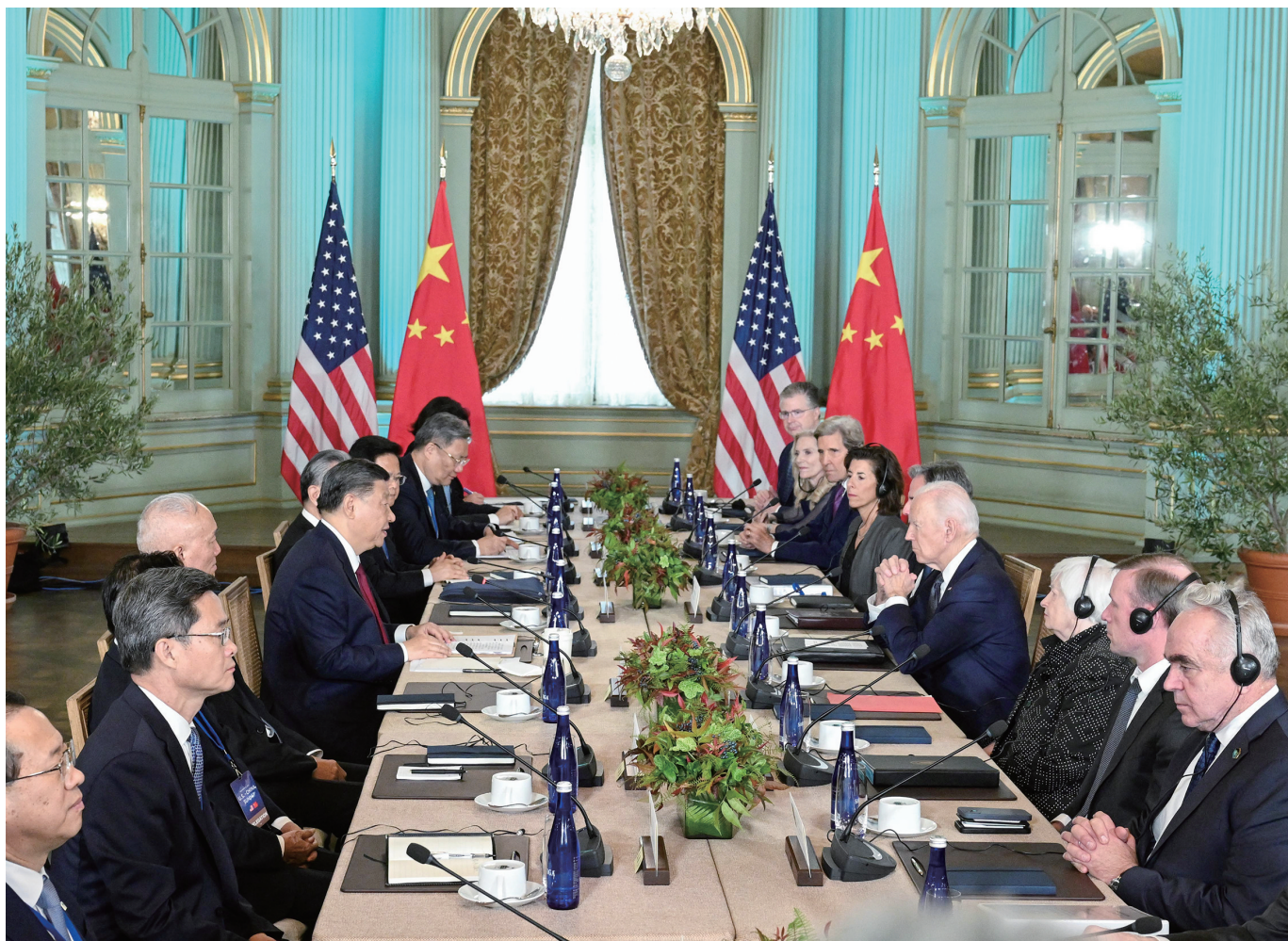
当地时间11月15日，国家主席习近平在美国旧金山斐洛里庄园同美国总统拜登举行中美元首会晤。