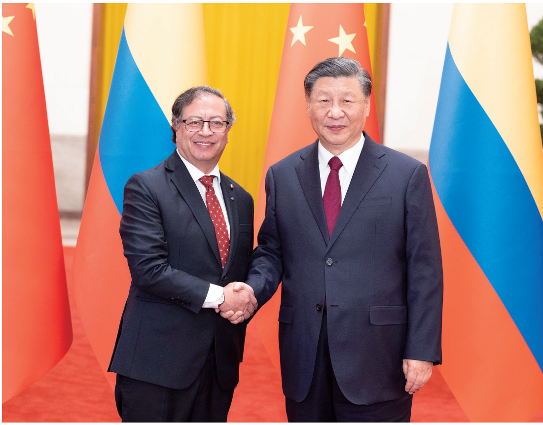
十月二十五日下午,国家主席习近平在北京人民大会堂同来华进行国事访问的哥伦比亚总统佩特罗举行会谈。这是会谈前,习近平在人民大会堂北大厅为佩特罗举行欢迎仪式。

新华社北京10月25日电(记者刘华)10月25日下午,国家主席习近平在人民大会堂同来华进行国事访问的哥伦比亚总统佩特罗举行会谈。两国元首宣布,将中哥关系提升为战略伙伴关系。