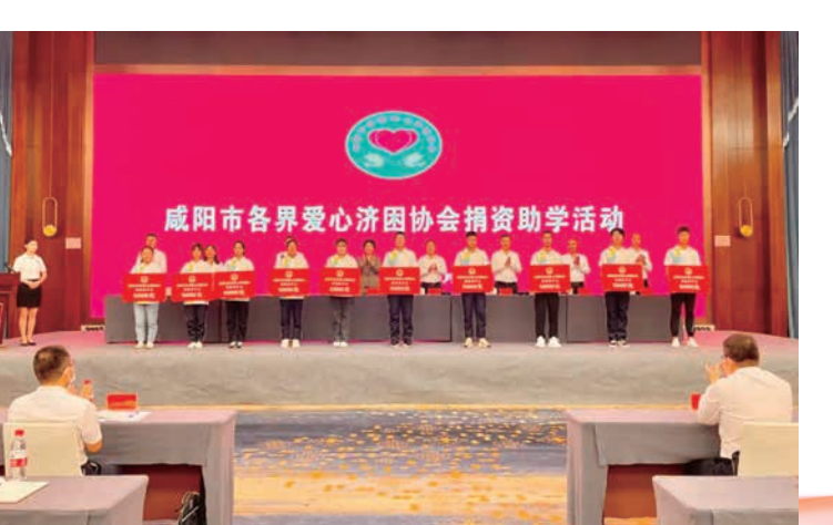
咸阳市各界爱心济困协会开展资助贫困大学生活动

风雨洗征程，回眸满堂春。2022年是咸阳市政协砥砺前行、顽强拼搏的一年，是担当尽责、奋发有为的一年，更是硕果累累、群众满意的一年。凡是过往，皆为序章；征途漫漫，惟有奋斗。让我们更加紧密地团结在以习近平同志为核心的党中央周围，坚持以习近平新时代中国特色社会主义思想为指导，深入学习贯彻党的二十大精神，在市委的坚强领导下，踔厉奋发、勇毅前行，凝聚人心、汇聚力量，为奋进中国式现代化新征程、加快建设现代化“西部名市丝路名都”、推动咸阳高质量发展实现新跨越而团结奋斗。