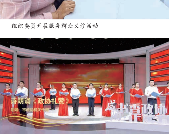
市政协组织机关干部开展“咸来读书会”活动

近日江山丽，春风花草香。沐浴新时代明媚春光，迈步新征程春江潮涌，咸阳政协事业在和谐的春风里播洒着春的阳光，迈出了新的步伐。 2022年，咸阳市政协坚持以习近平新时代中国特色社会主义思想为指导，认真学习宣传贯彻党的二十大精神，深入学习贯彻习近平总书记关于加强和改进人民政协工作的重要思想和来陕考察重要讲话重要指示，全面落实市第八次党代会部署，坚持人民政协性质定位，积极投身建设现代化“西部名市丝路名都”的宏伟实践，深入协商集中议政，强化监督助推落实，广泛凝聚人心力量，实现了九届市政协工作的良好开局。