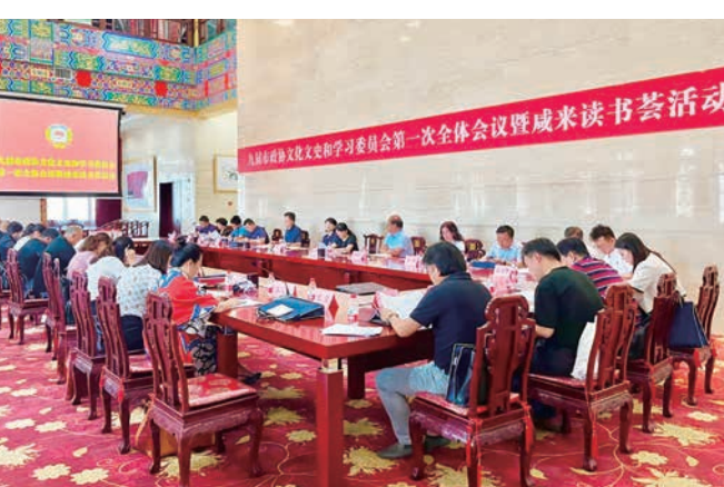
“书香政协”咸阳·正读书开展“咸来读书会”活动