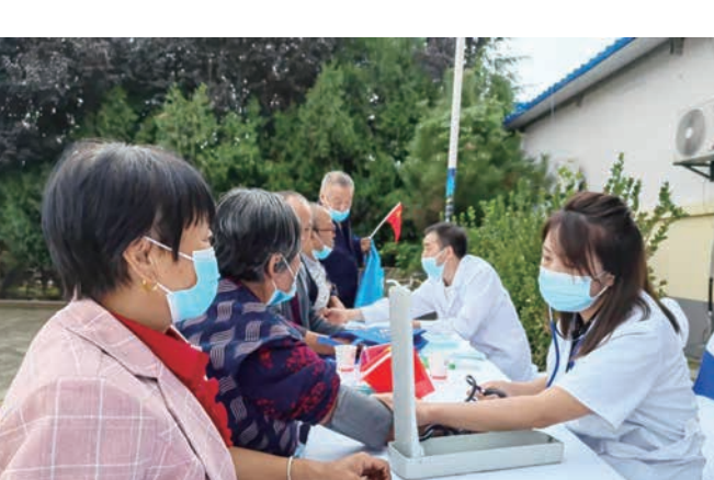
组织委员开展服务群众义诊活动