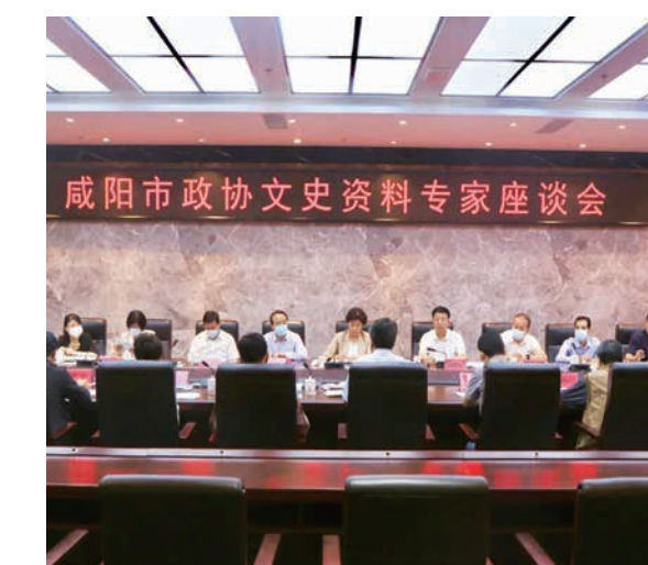
召开咸阳市政协文史资料专家座谈会

真抓实干固本强基，守正创新激发动力。咸阳市政协着眼于发挥政协系统独特优势，坚持在继承中创新、在创新中发展，积极探索履职新途径，拓展履职新空间，提升履职新效能。