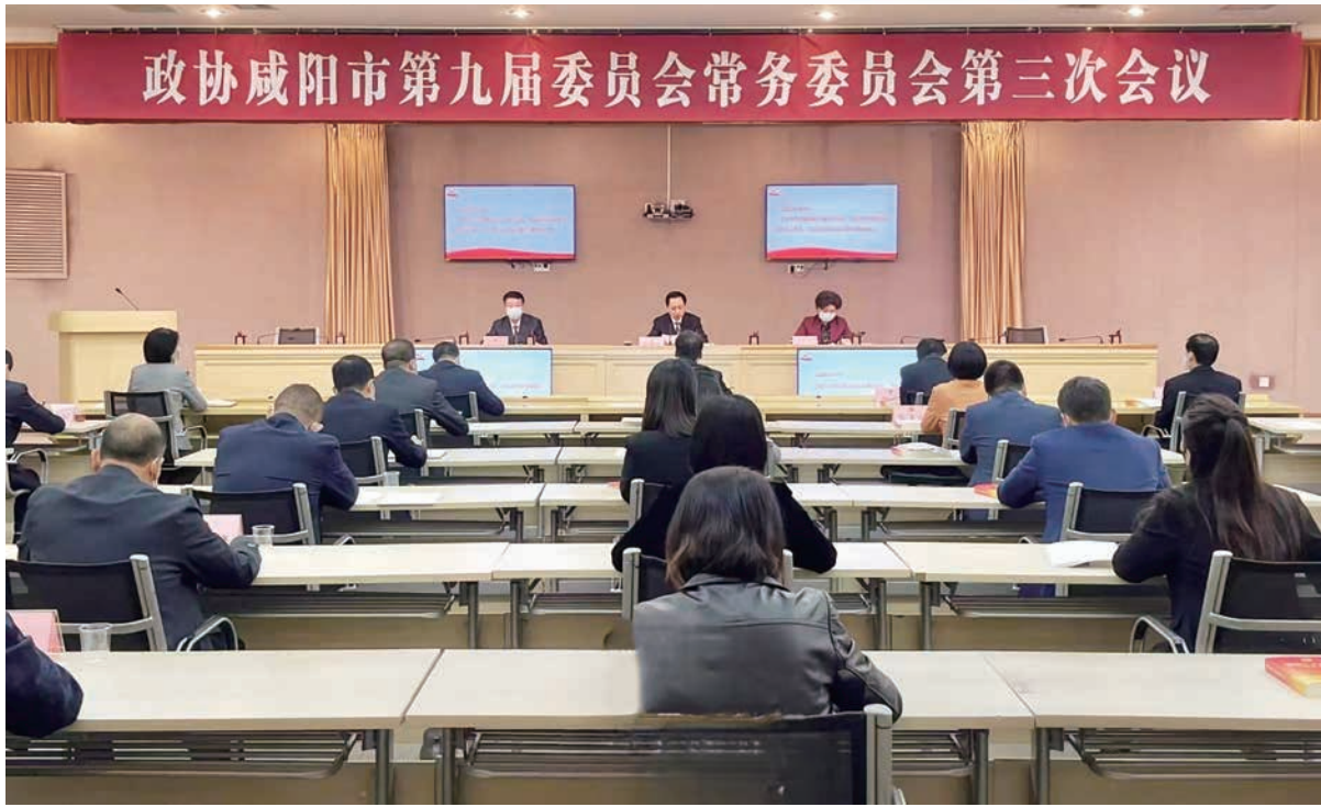
咸阳市委书记夏晓中出席市政协九届三次常委会议，并围绕“认真学习宣传贯彻党的二十大精神，在加快西安—咸阳一体化进程中贡献智慧和力量”主题作专题报告。