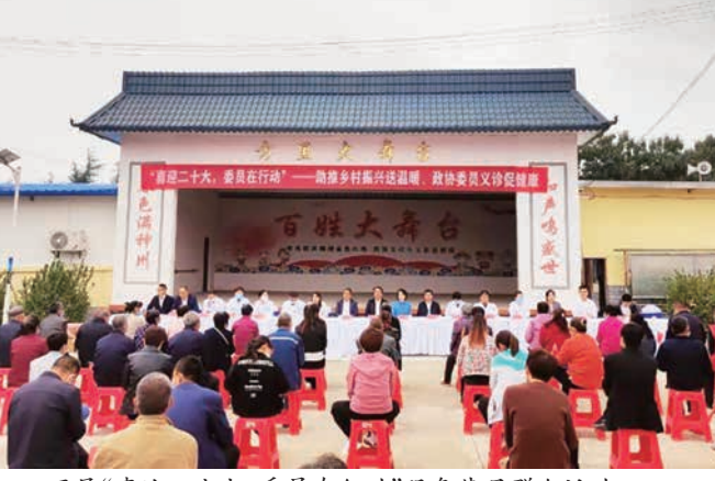
开展“喜迎二十大 委员在行动”服务基层群众活动