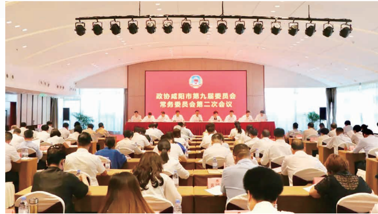
咸阳市市长冷劲松出席市政协九届二次常委会议，宣讲省第十四次党代会精神，围绕“当前稳增长和全市经济社会高质量发展”作专题辅导报告。