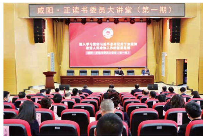
政协协办“委员大讲堂”

加强思想政治引领，广泛凝聚共识是人民政协履行职能的中心环节。咸阳市政协牢牢把握人民政协的政治属性，坚定不移地讲政治立立场，确保政协工作始终沿着正确的方向前进，努力形成心往一处想、劲往一处使的强大合力。