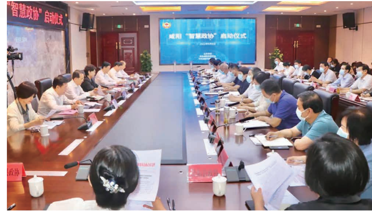
咸阳市“智慧政协”启动