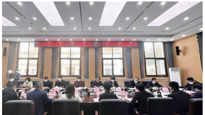
举办全市政协委员学习贯彻党的二十大精神交流座谈会

凝聚思想共识。坚持在加强学习、协商交流、团结联谊中凝聚共识。深化中共党史、新中国史、改革开放史、社会主义发展史和人民政协史的学习，制作“喜迎二十大、政协这十年——‘秦商量’履职创新故事”短视频，深入开展“喜迎二十大、奋进新征程”“书香政协”咸阳·正读书活动，引领广大政协委员增进对中国共产党和中国特色社会主义的政治认同、思想认同、理论认同、情感认同，不断夯实团结奋斗的共同思想政治基础。