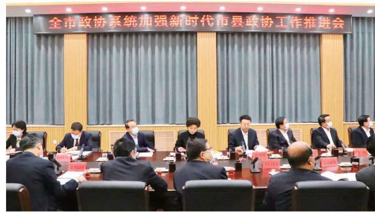
召开全市政协系统加强和改进市县政协工作推进会