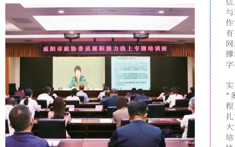
举办市政协委员履职能力线上专题培训

加强文史和宣传工作。注重发挥文史资料“存史资政、团结、育人”的重要作用，分别召开全市文史工作座谈会和文史专家座谈会，编制文史资料工作五年规划，《咸阳帝陵》等丛书被评为全省政协系统优秀文史资料图书，三原、长武、旬邑县政协文史工作受到省政协表彰奖励。办好咸阳政协网站、微信公众号，开辟“喜迎二十大·这十年委员说”“委员履职风采”等专栏，宣传报道全市经济社会发展成就和委员履职成果。全年在人民网、《人民政协报》《陕西政协》等省市媒体刊发政协信息210篇，《“书香政协”咸阳·正读书活动成为委员履职的“金钥匙”》《邀您“献良策”，征集“金点子”》等56篇稿件被中媒网刊发，发出了咸阳好声音。