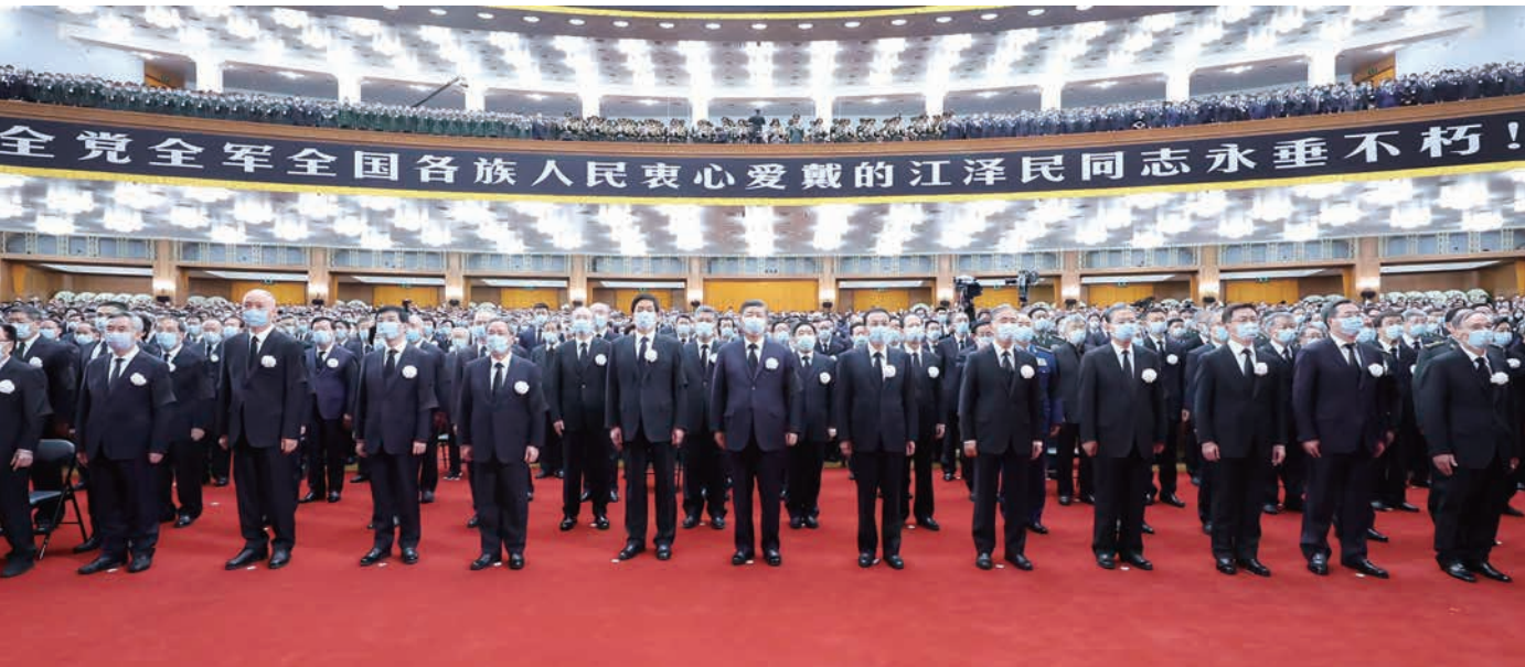
12月6日，中共中央、全国人大常委会、国务院、全国政协、中央军委在北京人民大会堂隆重举行江泽民同志追悼大会。习近平、李克强、栗战书、汪洋、李强、赵乐际、王沪宁、韩正、蔡奇、丁薛祥、李希、王岐山等参加大会。