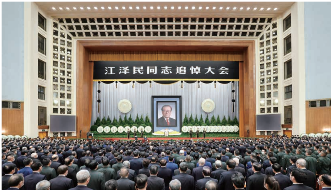
12月6日，中共中央、全国人大常委会、国务院、全国政协、中央军委在北京人民大会堂隆重举行江泽民同志追悼大会。