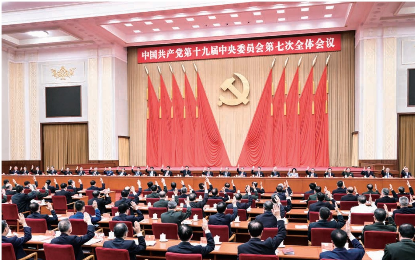
中国共产党第十九届中央委员会第七次全体会议,于2022年10月9日至12日在北京举行。中央政治局主持会议。新华社记者 燕雁 摄