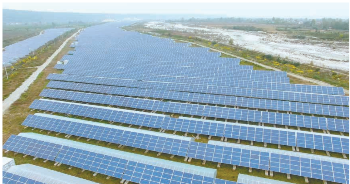
支持光伏发电项目