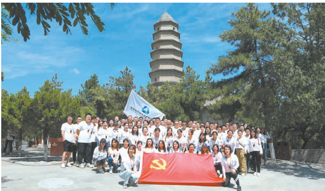
长安信托开展庆祝中国共产党成立100周年主题党日活动